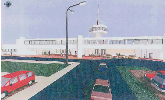
Un plastico che rappresenta l'esterno dello scalo aereo