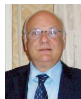
Il sindaco Franco Blaiotta

CASTROVILLARI. Non c'è pace per la villetta di via Mons. Angeloni. Alcuni cittadini sono tornati a lagnarsi delle cattive condizioni in cui versa. I cittadini-utenti, oltre a far presente la poca pulizia che impera nel perimetro vede ed al cattivo stato in cui versa una piccola fontana presente nella piazzetta, chiedono un maggiore controllo delle forze di polizia, poiché i muri continuano ad essere imbrattati ed arredo, che è stato posto a corredo della piazzetta, non consente ai bambini di usufruire degli ormai inesistenti spazi ludici. Infatti, non c'è più alcun gioco per i bambini. Da qui la richiesta al sindaco Blaiotta di attivare i canali Istituzionali affinché si proceda alla ripulitura di tutto il perimetro comunale; ma soprattutto alla installazione di un sistema di video sorveglianza che possa liberare l'area pedonale dalle fauci dei vandali. < (an.bis.)