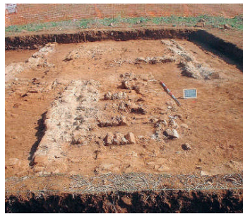
L'area archeologica di contrada Dolcetti

A conclusione dell'incontro, i dirigenti delle due aziende tedesche avrebbero inoltre piena disponibilità ad intervenire nella gestione dello stesso scalo aeroportuale sibaritano. <